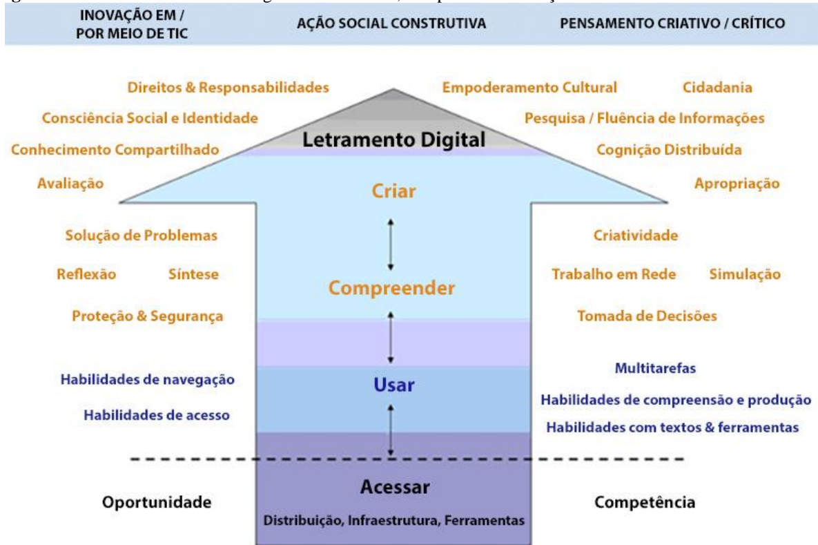
Figura 1: As bases do letramento digital: acesso e uso, compreensão e criação.