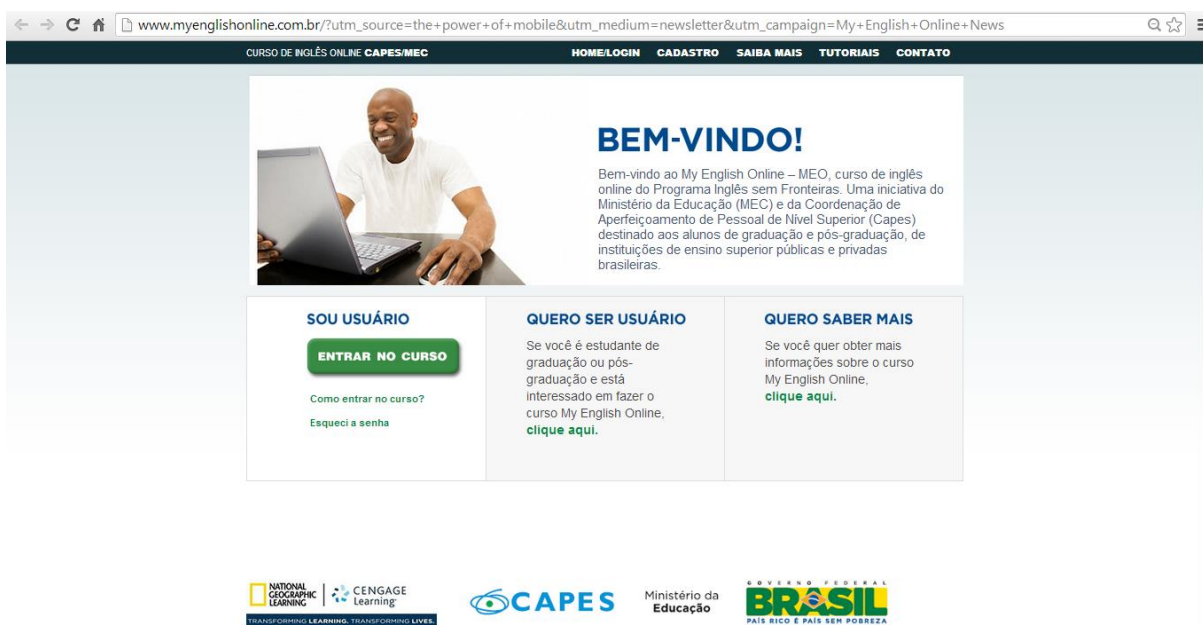
Figura 5: Página de abertura do MEO.

Fonte: My English Online. Disponível em: