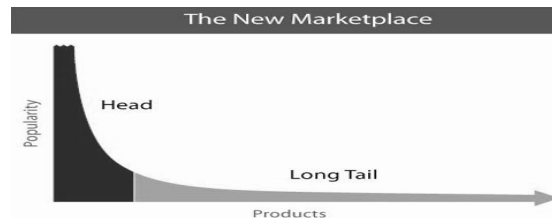
Figura 3. Gráfico Cauda Longa (Anderson, 2006)

serviços e o gerenciamento de dados para alcançar toda a web; atingir as beiras e não somente o centro, a longa cauda, e não somente a cabeça.